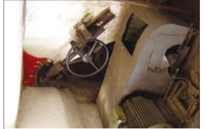
Турбіна - серце станції

У 2002 році керівництво ВАТ "ЕК "Житомиробленерго" вирішило відновити колишню працюючу гідроелектростанцію, і за кілька місяців Бистрійська міні-ГЕС знову запрацювала, генеруючи по 600-700 кВт. електроенергії щодоби. Звісно, за нинішніх умов і масштабів енергоспоживання такі показники є досить скромні і незначні, однак невеличка гідроелектростанція стала своєрідним символом вітчизняної малої електроенергетики, а ще прикладом того, що енергоресурс, нехай навіть маленької річки, можна і треба вдало використувати. А взагалі приємно бачити, як господарство ГЕС, прилегла до неї територія дбайливо доглянута, а навесні, коли паводок приносить "велику воду", гідроелектростанція й досі працює, вироб-