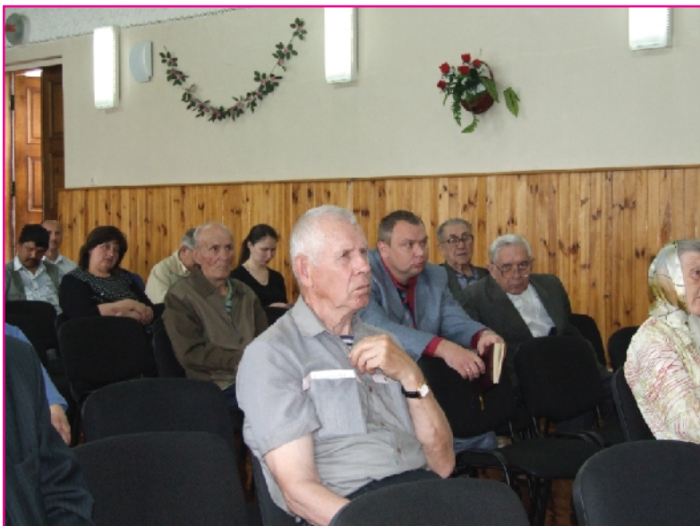
Акціонери уважно слухали виступи доповідачів

Щорічні збори акціонерів ВАТ "ЕК" Житомиробленерго", які відбулися 20 травня 2008 року за присутності двадцяти чотирьох акціонерів, що володіють 91,98% акцій енергокомпанії, розглянули всі дванадцять запропонованих до порядку денного питань та прийняли низку певних рішень.