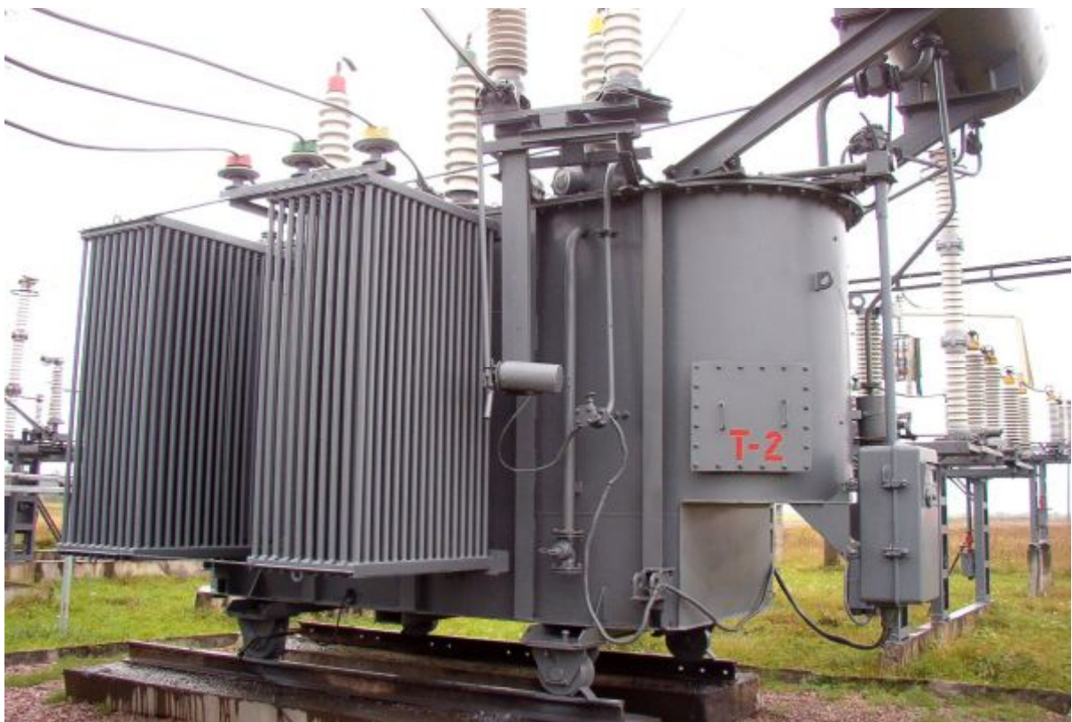
Трансформатор Т2 підстанція «Смолянка»