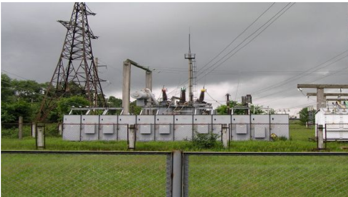
Підстанція « Народичі» 110/35/10