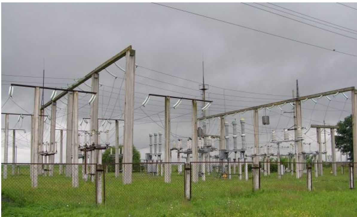
Відкритий розподільчий пристрій (ВРП 110 кВ)